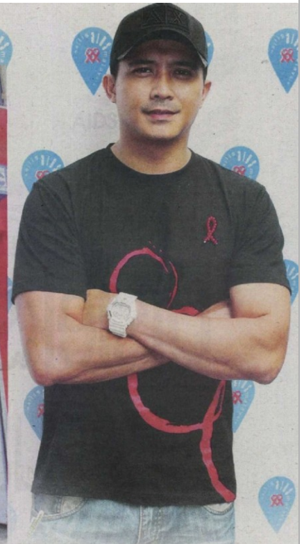
PELAKON Aaron Aziz salah seorang daripada 20 selebriti Sokongan Riben Merah Majlis AIDS Malaysia.

mereka mengambil ubat-ubatan yang diperolehi daripada hospital secara percuma. Selain itu, usaha lain seperti mendekati golongan berisiko ini akan terus dilakukan terutama menggalakkan mereka melakukan pemeriksaan kesihatan dan melakukan saringan ujian darah.