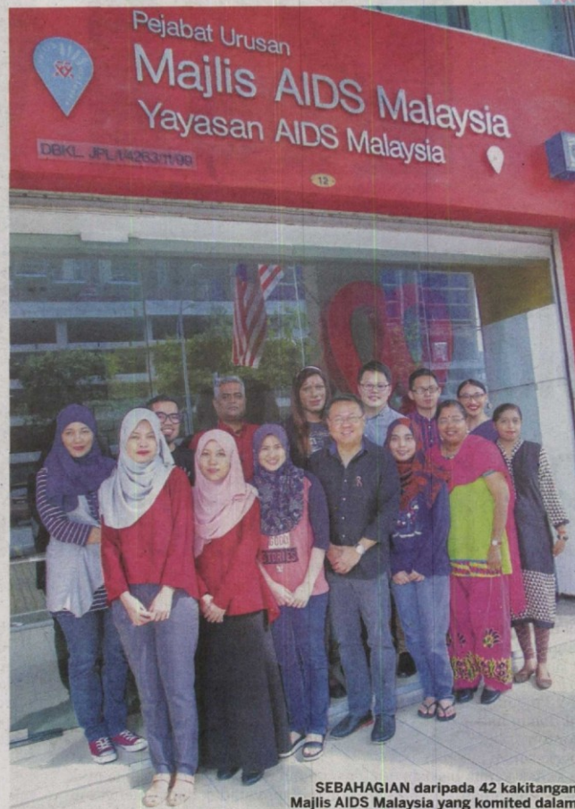
SEBAHAGIAN daripada 42 kakitangan Majlis AIDS Malaysia yang komited dalam menangani isu HIV/AIDS di Malaysia.

Sehingga tahun lalu, sebanyak 3,330 sahaja kes baharu dilaporkan sekali gus